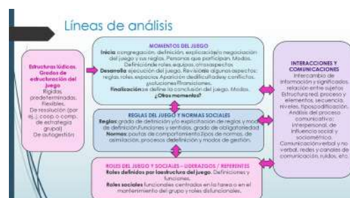
Figura 2. Líneas de análisis (elaboración propia)

A continuación, se elaboró una estructura flexible de líneas de análisis, que permitiría organizar la interpretación de los datos de manera integrada y relacionada entre las categorías, contemplando la simultaneidad y complejidad de acciones y sentidos que expresan.