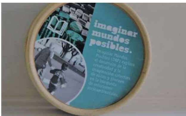
Imaginar mundos posibles