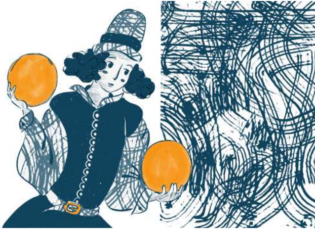
Ilustración de Belén Barboza, "Jugando en la rivera"