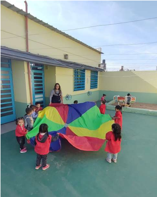
Imagen 2. Somos lo que jugamos. Clase de Educación Física. Sala de 2 años.