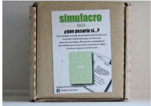
Simulacro, ¿Qué pasaría si...?