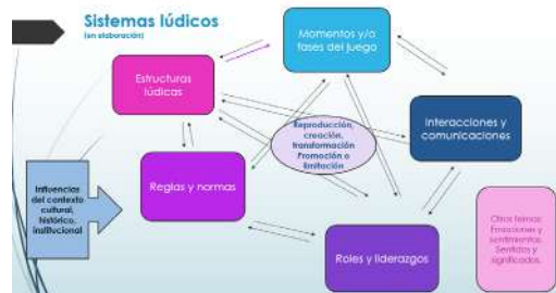
Figura 1. Sistemas lúdicos (elaboración propia)

Este sistema lúdico permitiría organizar y analizar los datos en función de algunas categorías teóricas, que se interrelacionan e influyen con otras, de manera simultánea y/o sucesiva: estructuras lúdicas, momentos y/o fases del juego, interacciones y comunicaciones, roles y liderazgos, y reglas y normas. Estos aspectos pueden estar condicionados por otros contextos macro, como el contexto cultural, histórico e institucional, o por aspectos subjetivos, como la emocionalidad, las experiencias de vida, las personalidades, que serán abordados en la medida que emerjan de los datos.