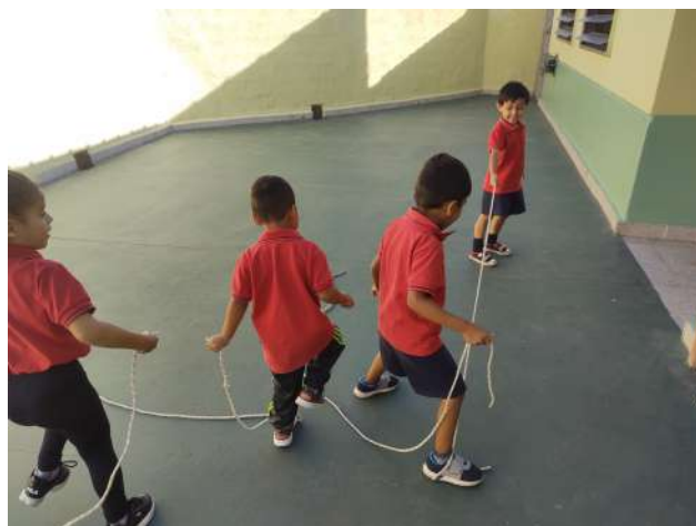
Imagen 1 ¿Y si formamos una red con todos/as los/as jugadores? Clase de Educación Física. Sala de 4 años.

Tal y como plantea Linaza, los niños y las niñas tienen derecho al juego como expresión directa de su condición de menores (2013, p. 104), por lo tanto tomando como referencia la realidad de vida descrita en párrafos anteriores, intento hacer explícita la necesidad de garantizar esos derechos elementales.